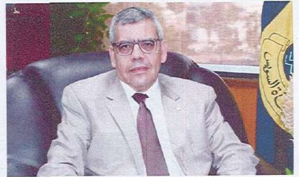
أ.د/ محمد سعد زخول نائب رئيس الجامعة لشئون الدراسات العليا والبحوث